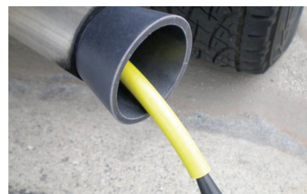
Vuodonetsintälaitetta voidaan käyttää myös pakoputkiston tiiviystarkastukseen