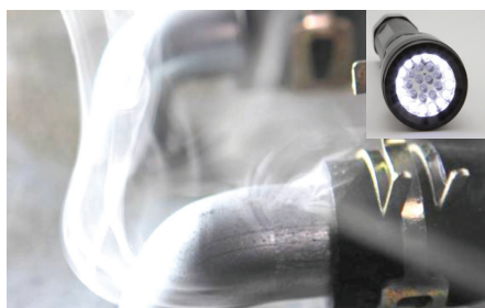
Valkoinen valo auttaa savun havaitsemisessa

Paketin sijaan voidaan käyttää myös 7 bariin esisäädetyllä painesäätimellä varustettua isompaa typpipulloa. Sen liittämiseen SMT 300:aan tarvitaan erikseen tilattava letku.